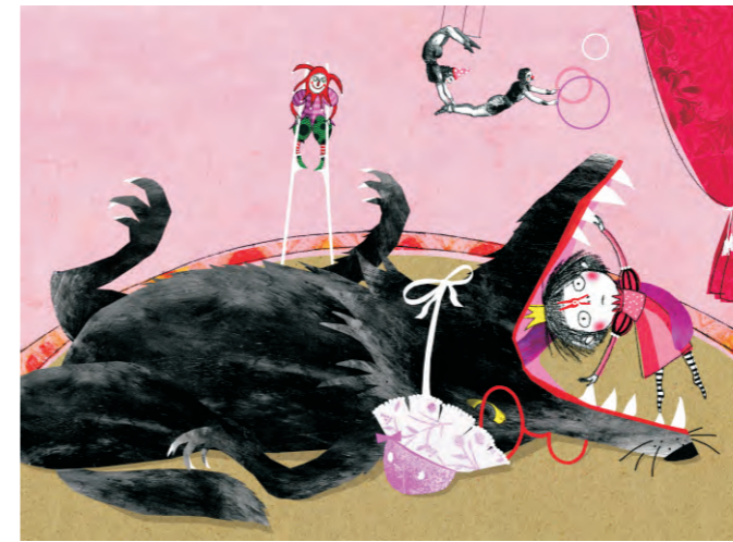
Susanne Straßer, Wolfgefressen