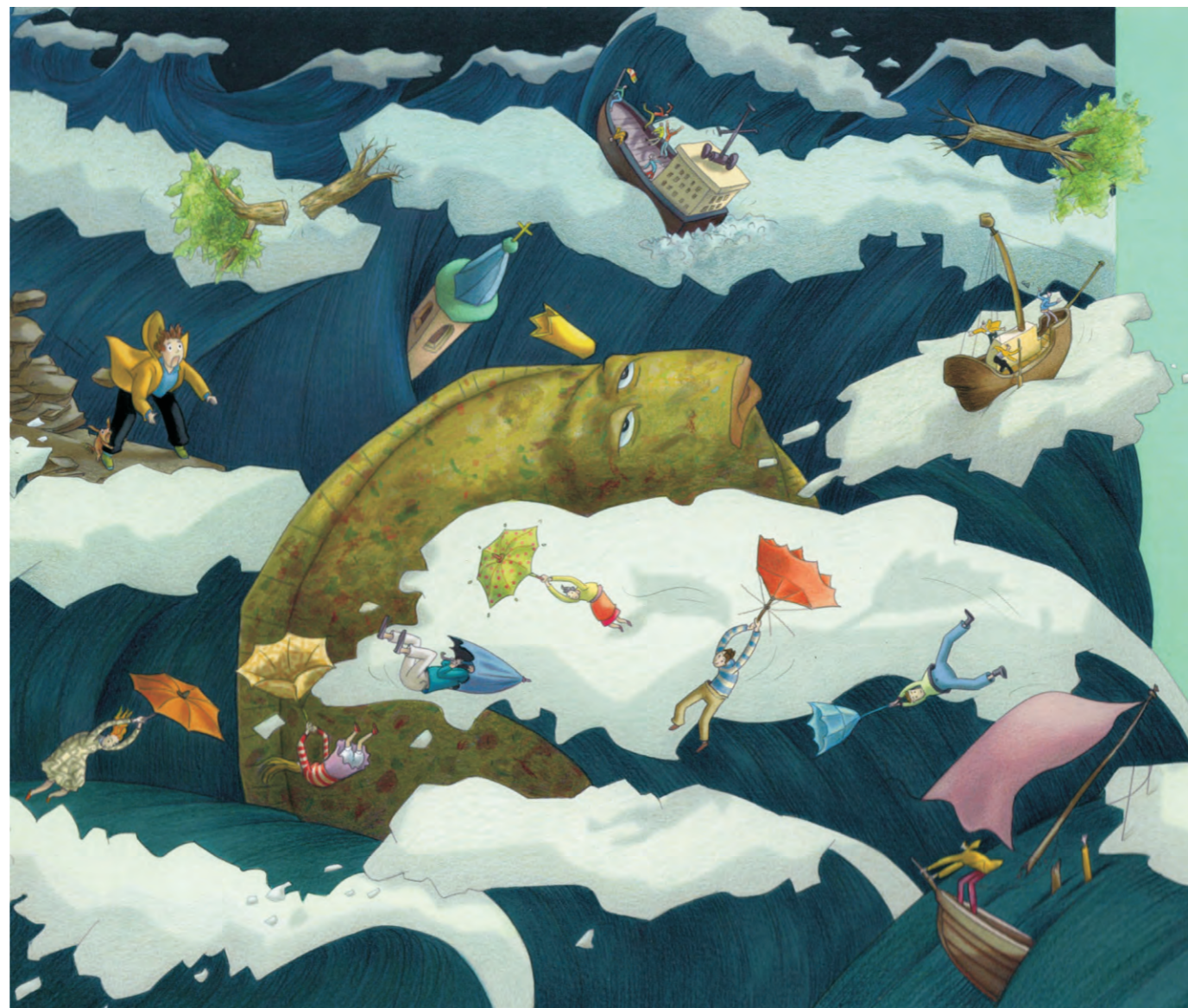
Sabine Wilharm, Illustration zu „Vom Fischer und seiner Frau“, Ausschnitt, © Aufbau- Verlag

Die Galerie "Sonnensegel" wird gefördert durch die Ministerien für Wissenschaft, Forschung und Kultur sowie für Bildung, Jugend und Sport des Landes Brandenburg, die Stadt Brandenburg a.d. Havel.