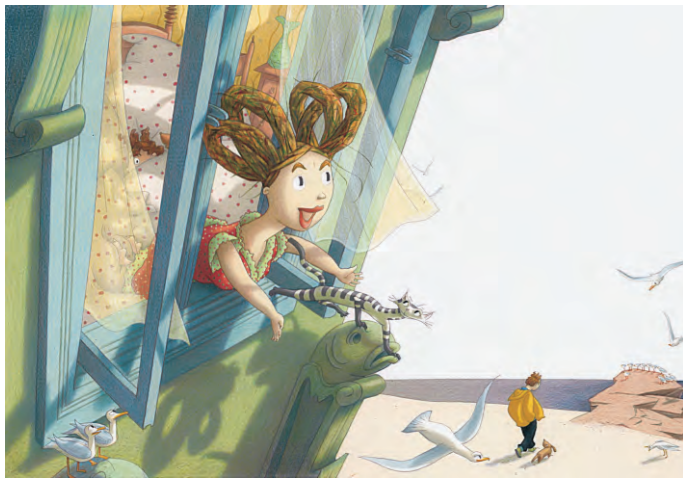
Sabine Wilharm, Illustration zu „Vom Fischer und seiner Frau“, Ausschnitt