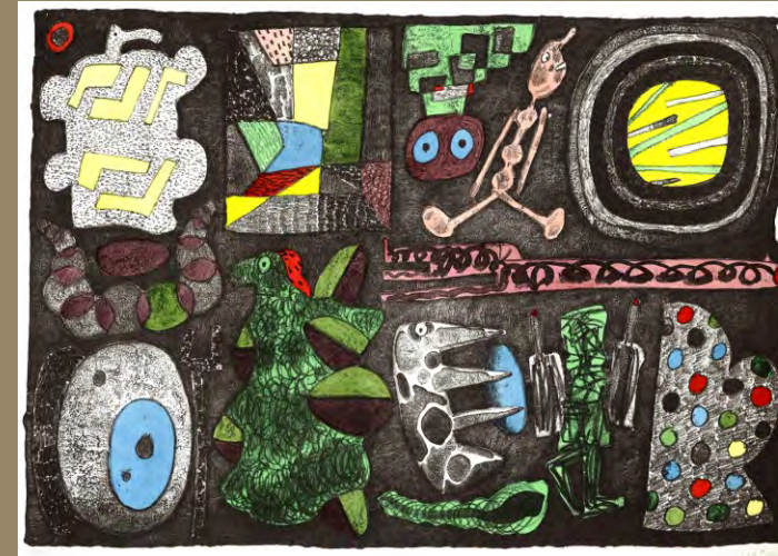
„Jäger“, Lithografie, handkoloriert

Gestalten, auch Zitate mittelalterlicher religiöser Kunst verbreiten sich labyrinthartig über die Fläche, bevölkern in großer Dichte die gemalten bzw. gezeichneten Bildteppiche. Viele der Darstellungen wirken heiter, besonders wenn archaische Bildelemente mit Motiven aus der modernen Welt neue Bildsymbiosen eingehen, aber dieser Eindruck kann auch täuschen. Alles, was tief anthropologisch in uns schlummert, taucht in den Bildwelten von Frieder Heinze auf. Urempfindungen wie Liebe bzw. Zuneigung werden formelhaft dargestellt, aber auch Angstvolles sowie Ab- und Doppelgründiges kann entdeckt werden. Nicht von ungefähr wurde oft und richtig auf die Nähe der Bildsprache des Künstlers zu prähistorischen Darstellungen verwiesen. Frieder Heinze gefällt das Diktum von Picasso, der nach Besichtigung neu entdeckter Höhlenmalereien der Steinzeitmenschen mit Blick auf die eindrucksvollen Tierdarstellungen gesagt haben soll, dass die Künstler nichts dazugelernt hätten. Auch Frieder Heinze vertraut der Wirkung, der universellen Verständlichkeit urzeitlich anmutender Figuren und