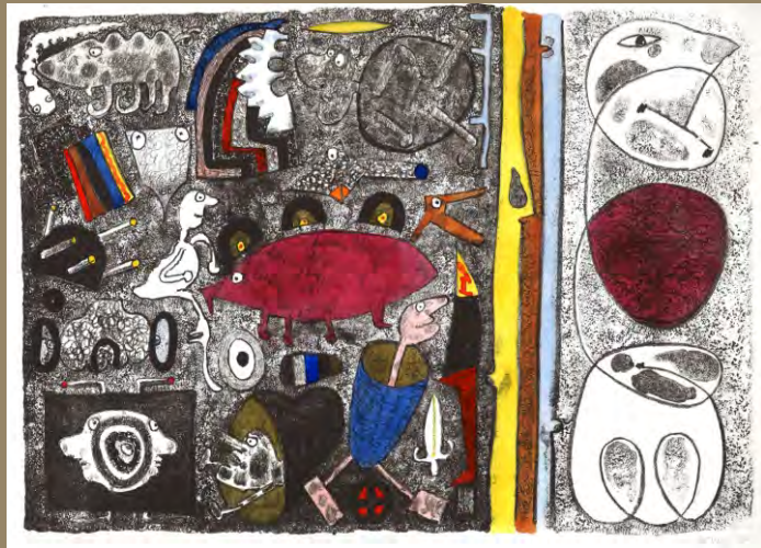
„Licht im Dunkel“, Lithografie, handkoloriert

„Wir stehen in Verhältnissen mit allen Teilen des Universums sowie der Zukunft und Vorzeit. Es hängt nur von der Richtung und Dauer unserer Aufmerksamkeit ab, welches Verhältnis wir vorzüglich ausbilden wollen ...“ Novalis