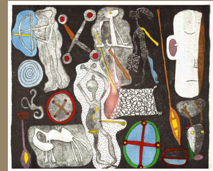
„Fohlen“, Lithografie, handkoloriert

Ornamente. Sie seien “auch ohne das Wissen, das man angeblich dazu braucht, gut lesbar. Die Zeichen sprechen direkt und sofort...“ In der Auseinandersetzung mit diesem bildnerischen Erbe entwickelte der Maler, Objektkünstler und Grafiker eine Ausdrucksform, die eine Einheit zwischen Bildform und -träger (Filz, Fahnen, Kaschuren und Rollbilder) anstrebt. Ausdruck dieser Bestrebungen war u.a. die vielbeachtete Veröffentlichung des gemeinsam mit dem Künstlerfreund Olaf Wegewitz gestalteten Künstlerbuchs “unaulutu. Steinchen im Sand“ (1983 -86), dessen Bildsprache maßgeblich von Zeichnungen der Karaja-Indianer Südamerikas beeinflusst wurde. Aber nicht nur Prähistorisches bzw. die sogenannte Kunst der Naturvölker bieten Inspirationsquellen. Die ausgestellten Lithografien, die in Teilen handkoloriert wurden, weisen auch deutliche Bezüge zu surrealistischen Strömungen auf. Der schier unerschöpfliche Erfindungsreichtum Frieder Heines schlägt eine Brücke von den phantastischen und seltsam verstörenden Figuren eines Hieronymus Bosch hin zu Bildschöpfungen von