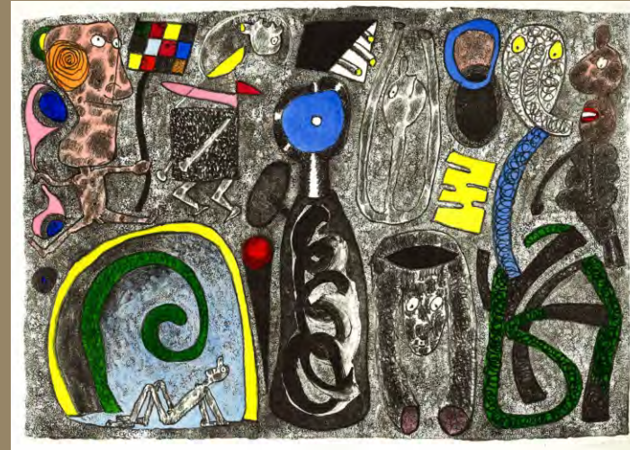
„Ankunft“, Lithografie, handkoloriert