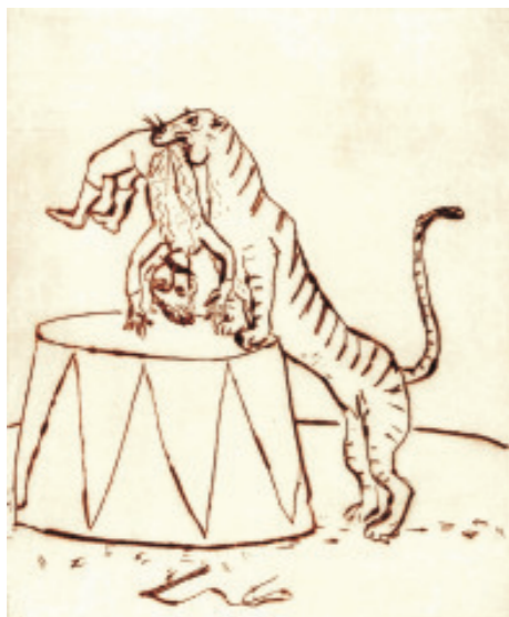
„Ende der Vorstellung“

plastische Gestaltung und Spiel mit eigenen Masken auf Anfrage als Mehrtagesprojekt; Unkostenbeitrag je nach Aufwand