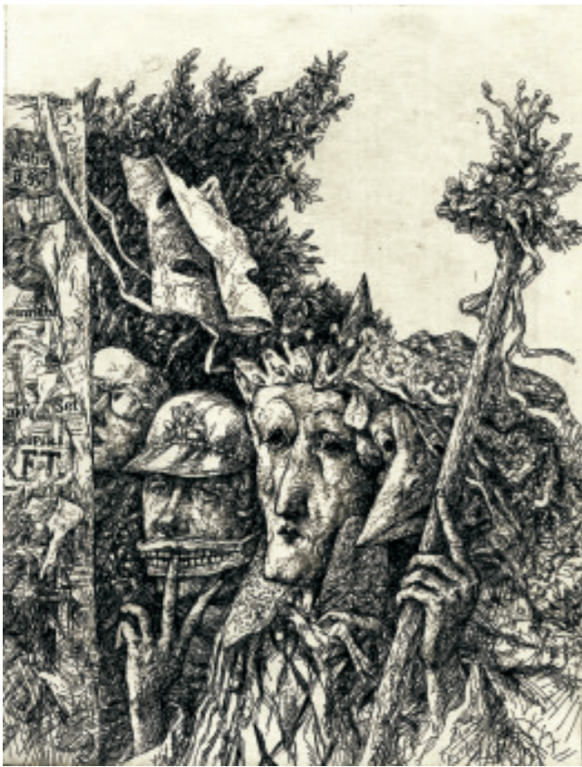
„Maske mit Träne“