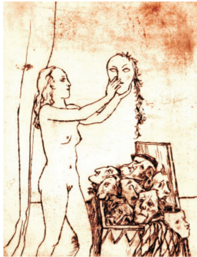
„Mädchen am Maskenkasten“